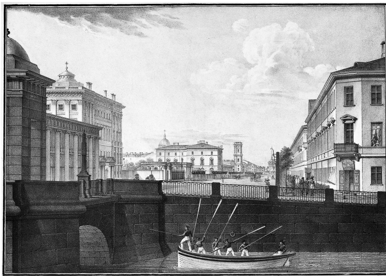
Вид Фонтанки у Аничкова моста. Гравюра Александра Тона. 1820-е годы

Повесть начинается с описания Невского проспекта в разное время суток. Завершается этот фрагмент сценой вечернего гуляния на главной городской улице. Это позволяет создать своего рода панораму столичной жизни, причем весьма парадоксальную по приемам. Как указывает Юрий Тынянов, «Невский проспект» основан на эффекте полного